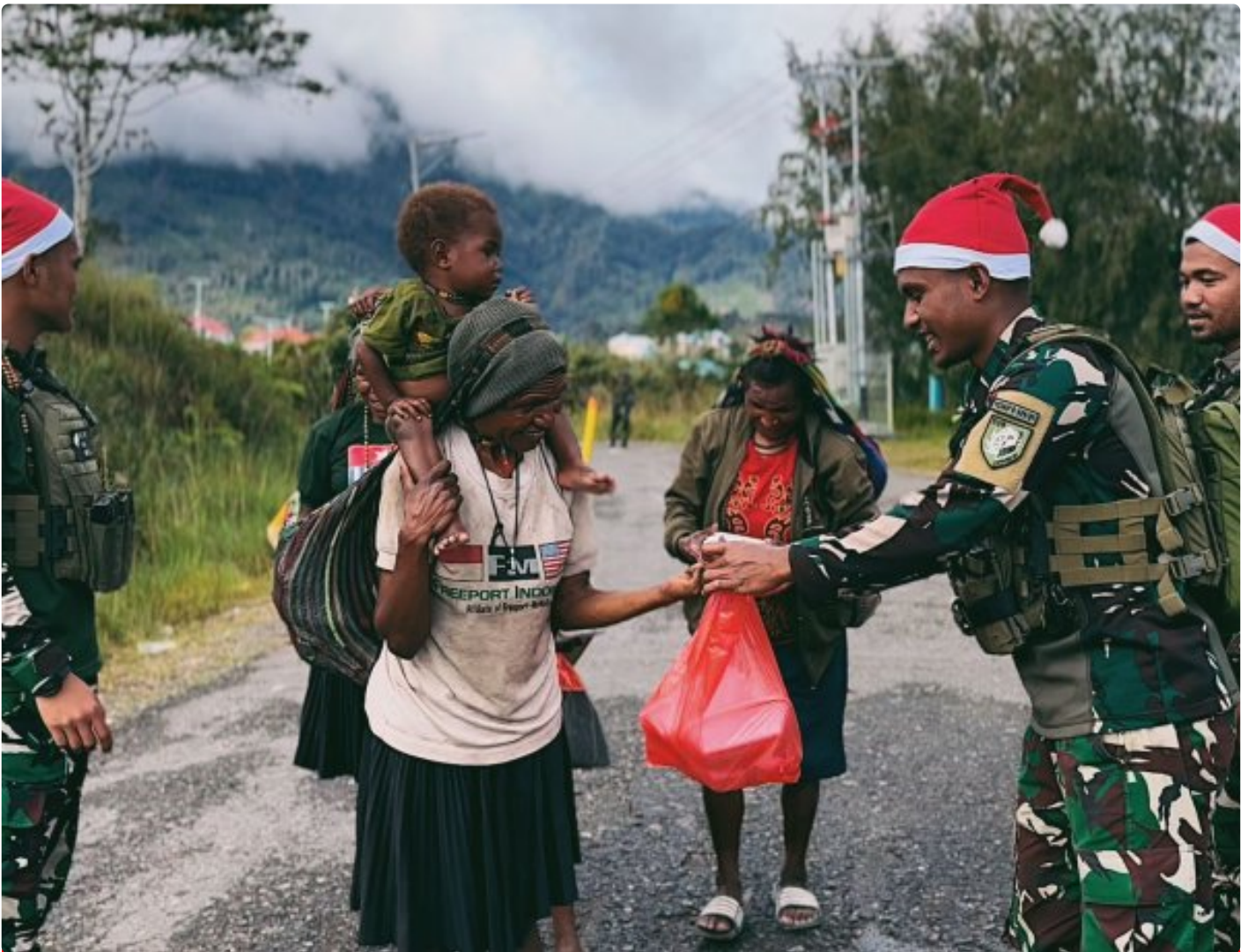
Foto: Satgas Yonif 509 Kostrad memberikan makna baru pada patroli keamanan dengan berbagi kebahagiaan bersama masyarakat di Intan Jaya, Papua.

PAPUA- Dalam balutan semangat Natal yang damai, Satgas Yonif 509 Kostrad memberikan makna baru pada patroli keamanan dengan berbagi kebahagiaan